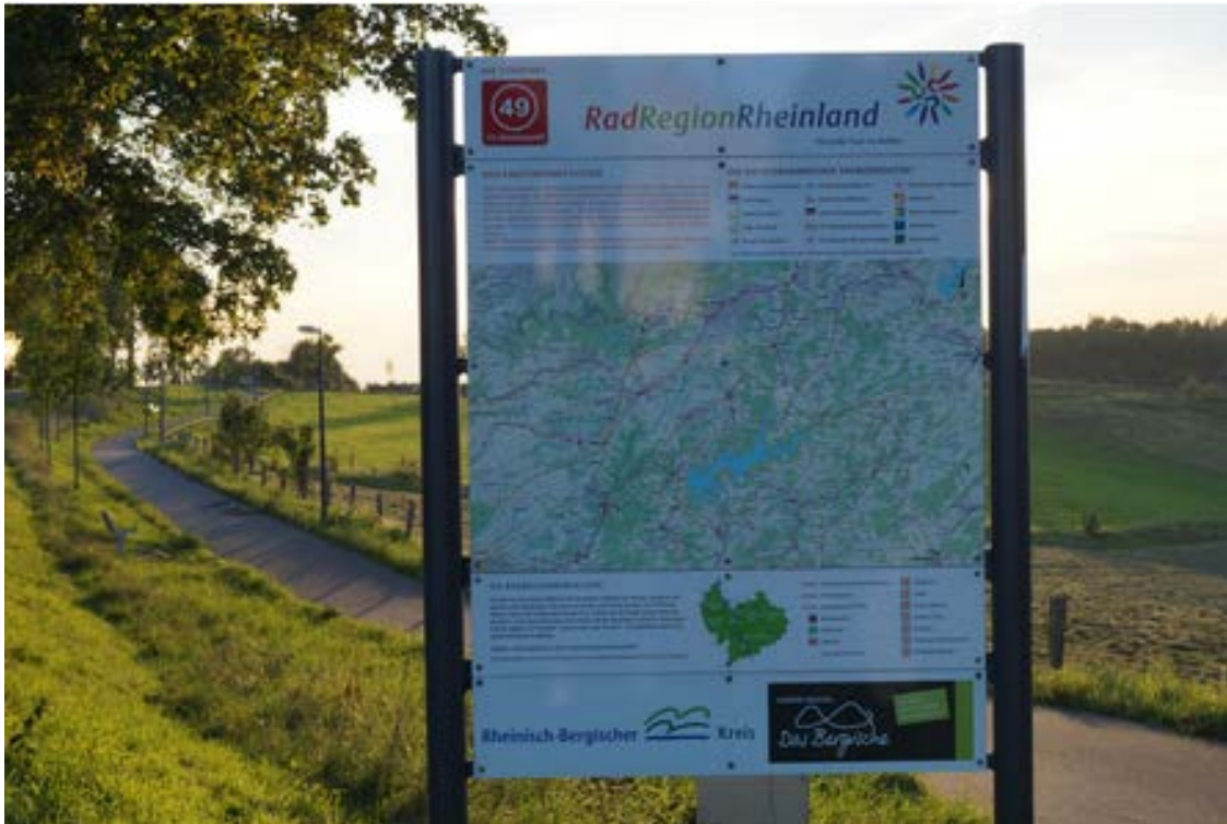
Foto 2: Naturarena Bergisches Land GmbH, © Das Bergische - Maren Pussak