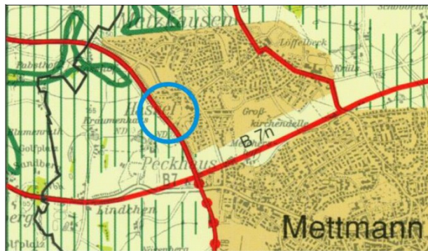
Auszug Regionalplan (ohne Maßstab)

Der Regionalplan stellt den gesamten Planbereich der 44. Flächennutzungsplanänderung als „allgemeinen Siedlungsbereich“ dar.