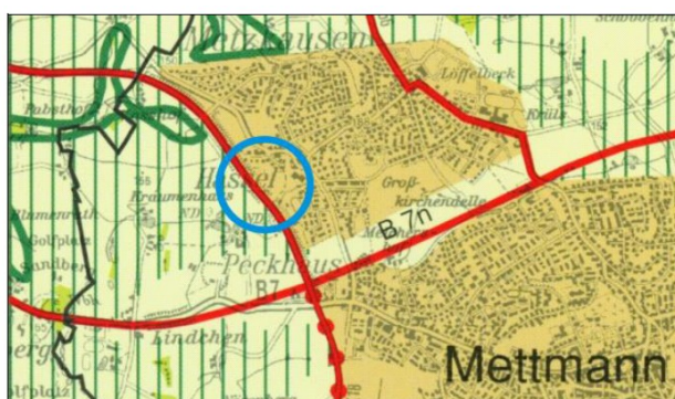
Auszug Regionalplan (ohne Maßstab)

Der Regionalplan stellt den gesamten Planbereich der 44. Flächennutzungsplanänderung als „allgemeinen Siedlungsbereich“ dar.